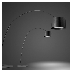
Twice as Twiggy