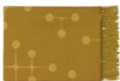
Eames Wool Blanket moutarde