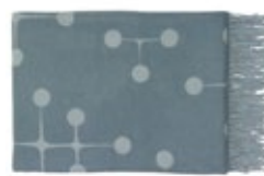
Eames Wool Blanket bleu clair