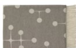
Eames Wool Blanket taupe