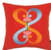
Embroidered Pillows Double Heart, rouge H 400 x P 400