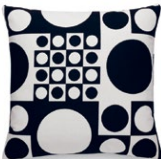
Classic Pillows Maharam Geometri black/white H 400 x L 400