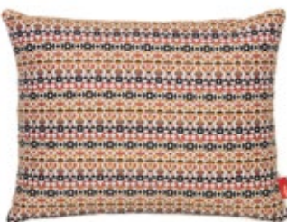
Classic Pillows Maharam Arabesque, crimson pink H 300 x L 400