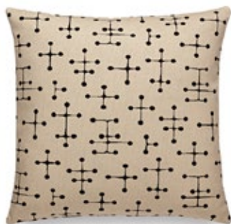
Classic Pillows Maharam Small Dot Pattern Document H 400 x L 400