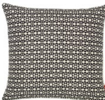
Classic Pillows Maharam Facets, black/white H 300 x L 400