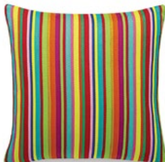
Classic Pillows Maharam Millerstripe multicolored bright H 400 x L 400